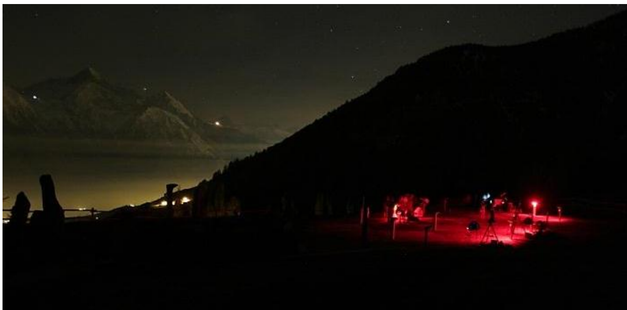
Fig. 2. Immagine notturna a lunga esposizione che mostra sia come le piazzole esterne siano protette dall'inquinamento luminoso di Aosta, sia quanto sia confinata l'illuminazione dei lampioni con luci a LED rossi, appositamente tenuti accesi per questa ripresa.